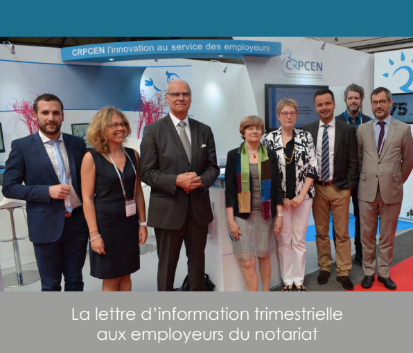
La lettre d'information trimestrielle aux employeurs du notariat