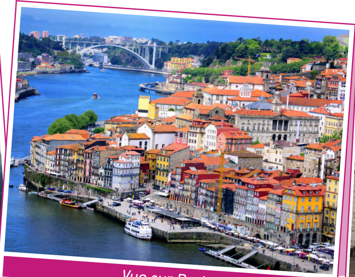
Vue sur Porto