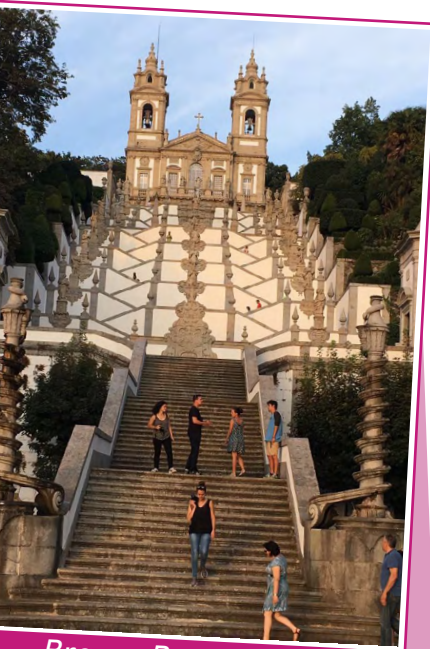
Braga, Bom Jesus do Monte

Pour flâner, rien de tel que le quartier médiéval de la Ribeira, plus vieux quartier de la ville, dont les ruelles escarpées sont bordées de cafés et de maisons colorées. Pour découvrir la copieuse et excellente gastronomie portugaise, on y trouve d'ailleurs le long du fleuve, de très bons restaurants répondant à toutes les envies.