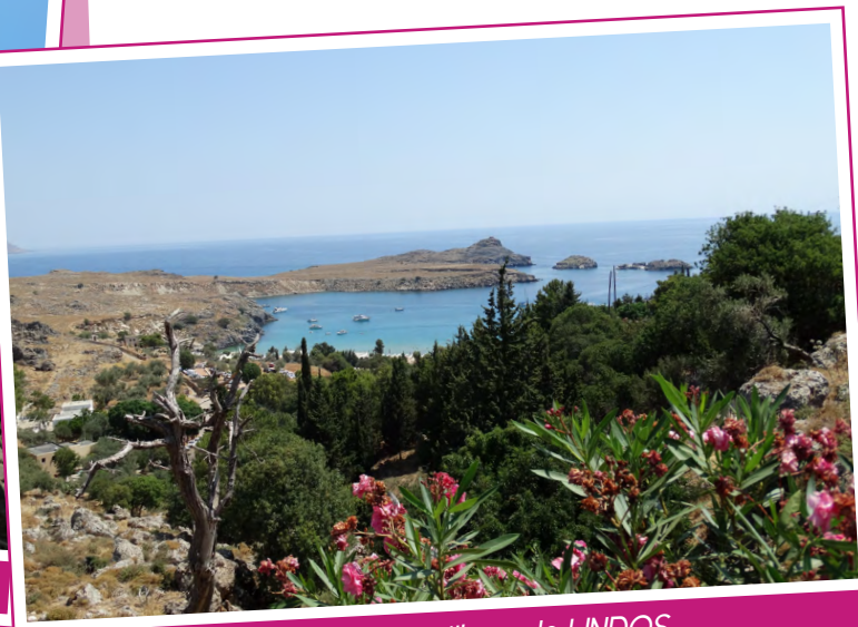
La mer vue du village de LINDOS

Mais cela n'enlève rien à la gastronomie grecque qui est succulente, originale, copieuse. On vous amène toutes sortes de plats chauds ou froids, des mezzés (sorte de tapas), fruits de mer (les calmars et le poulpe sont un vrai délice) et la fameuse salade grecque, accompagnée de Feta, le célèbre fromage de chèvre et de brebis. Pour accompagner tous ces mets, rien de tel qu'un petit ouzo, sorte de pastis grec. 1