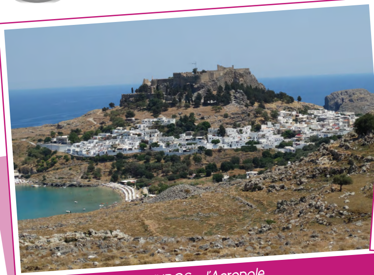
LINDOS - l'Acropole