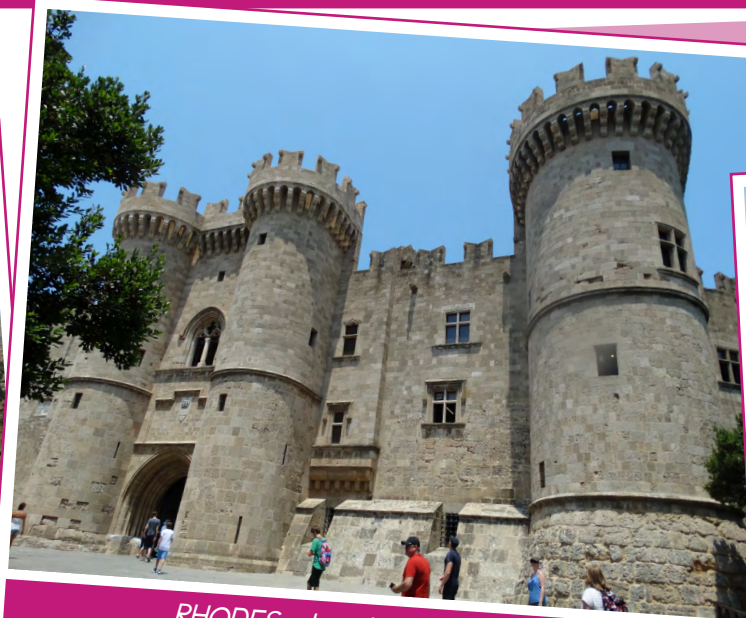
RHODES - le palais des chevaliers