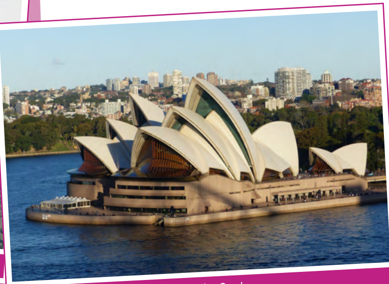
L'Opéra de Sydney