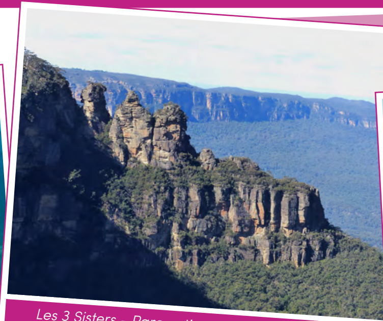
Les 3 Sisters - Parc national des Blue Mountains