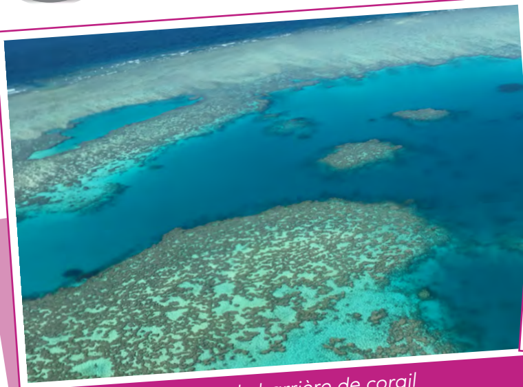
La grande barrière de corail